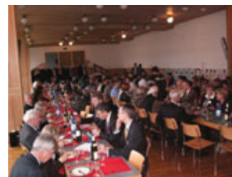
Vasario 16-osios renginio svečiai ir dalyviai, susėdę prie šventinių stalų, 2007 m. Ciurichas