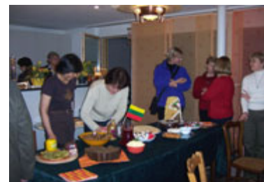
Lietuviškų vaišių stalas