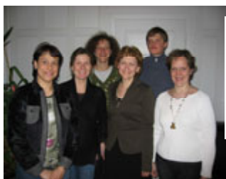
ŠLB valdybos nariai po pirmojo 2007-ųjų m. valdybos susirinkimo