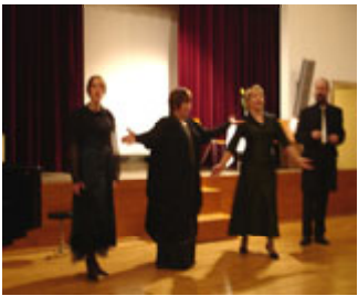
Finalinė pjesės scena