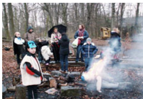
"Lituanicos" mokiniai su tėveliais

Antrąjį sekmadienį pasikvietėme daugiau vaikų. Net ir