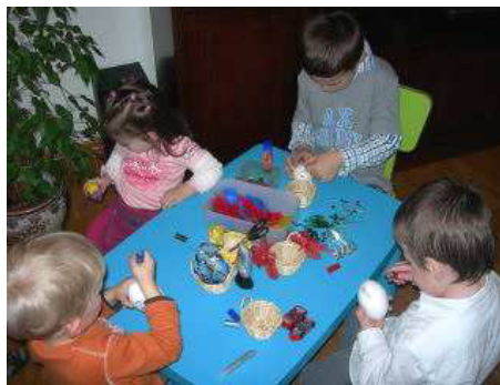
Velykų šventė Lugane

Visiems buvo linksma. Kiekviena Tičino lietuvaitė, dalyvavusi renginyje, parsinešė namo ne tik savo vaikiukų velyki-