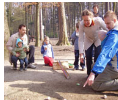
Lietuvaičiai kartu su atžalomis ridena margučius, 2007 m. balandis

Pakalbėję, pasitarę ir kiaušinius numarginę, visi patraukė į Froloo miško laukymę. O ten tai ir ugnį kūreno, ir margučius rideno, ir smagiai kalbėjosi, ir tatai darydami savo atžalomis džiaugėsi. Kiek gražių kiaušinių jie primargino, kiek jų prirideno ir kiek savo juoku miško žvėrelius stebino!