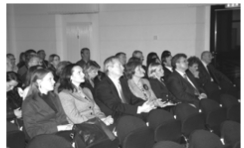
Nuotraukoje renginio svečiai ir organizatoriai

Po Pirmojo pasaulinio karo, 1918 m., lietuviai atkūrė savo valstybę, kuri gyvavo iki 1940 metų. Po to sekė 50 metų sovietų okupacija. Tačiau mūsų tautai nepritrūko jėgų ir šiais sunkiais laikais. Mes išlaikėme savo kalbą ir kultūrą.