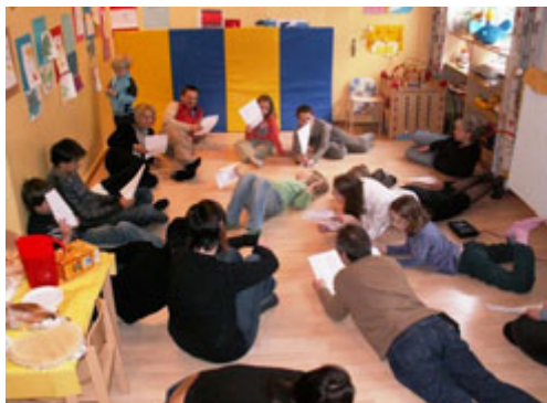
Padainuosim mes sugulę...

Visa tai, kažkada būdama vaikas, ir dainavau ir žaidžiau vaikų darželyje. Niekada nebūčiau pagalvojusi, kad tai teks daryti jau būnant suaugus. Tuo labiau lietuviškus papročius ir žaidimus aiškinti lietuviškoje sekmadieninėje mokyklėlėje Šveicarijoje... Kur tas gyvenimo vingiuotas kelias tik nenuveda.