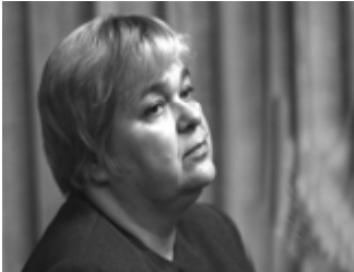
Šiuolaikinė lietuvių poetė Dovilė Zelčiūtė