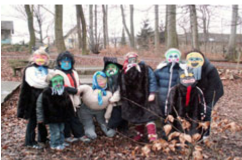
Užgavėnės su Morė