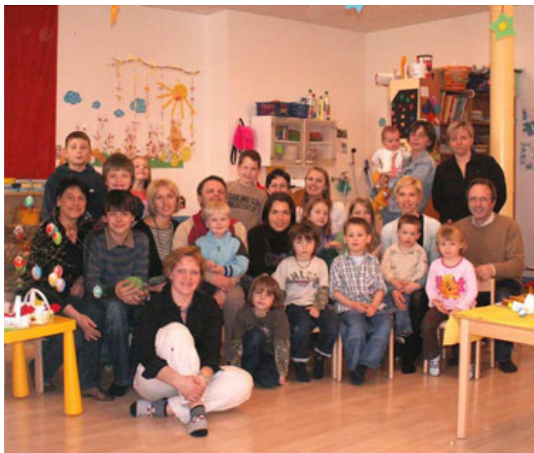
Velykų šventė "Lituanicoje"