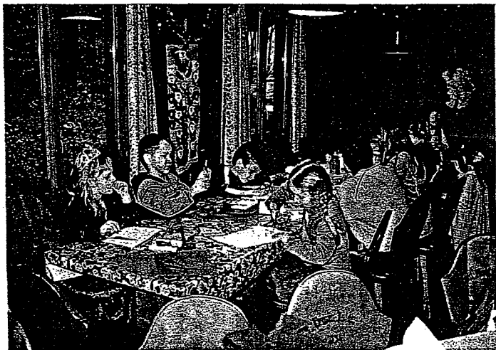
Pačių pagamintais žaisliukais buvo papuošta eglutė