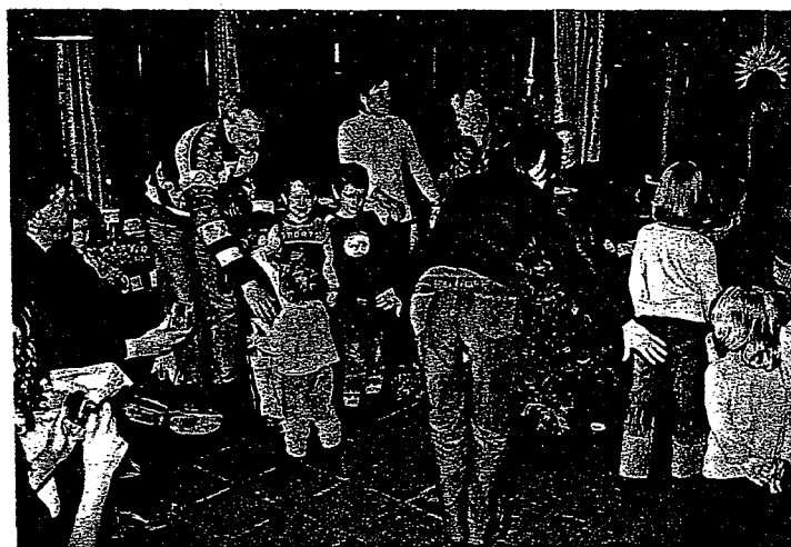
Tuoju suksis ratelis apie eglutę

Didelis dėkui visiems, kurie padėjo šventę parengti, praveisti, bei padėjo indus išplauti! Dėkoju ir už atvirutes, kurias gavau po šventės.