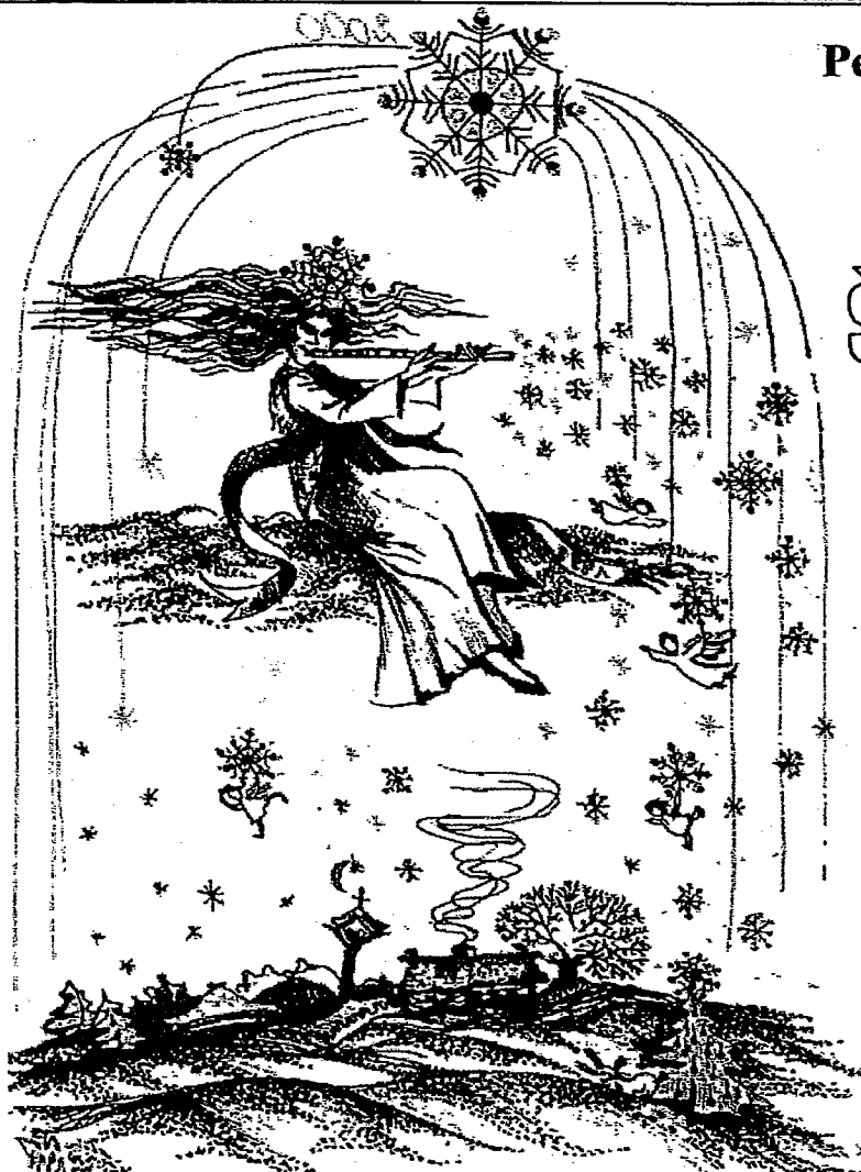
V. Paukštienės piešinys

ŠLŽ pirmasis numeris išėjo 1951 m. Iki 1953 m. buvo išleisti 7 numeriai. Tolesnis leidimas nutrūko